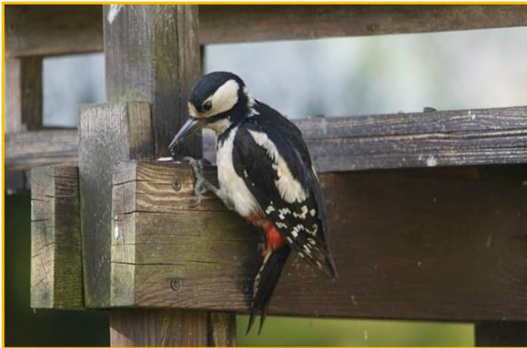
Zdjęcie 2 Dzięciół duży wiosna 2020 fot. Teresa Magdy