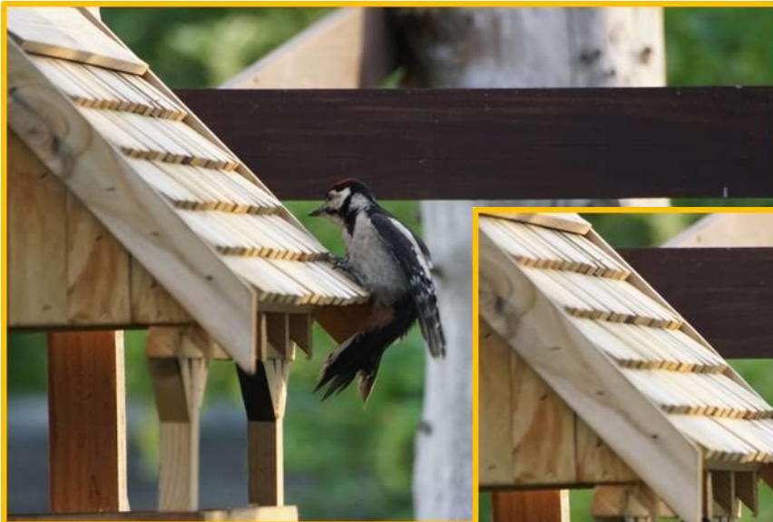
Zdjęcie 9 i 10. Dzięcioł duży na nowym karmniku. Wiosna 2023.