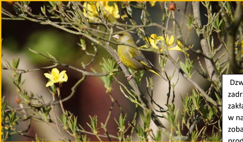
Zdjęcie 20. Dzwoniec