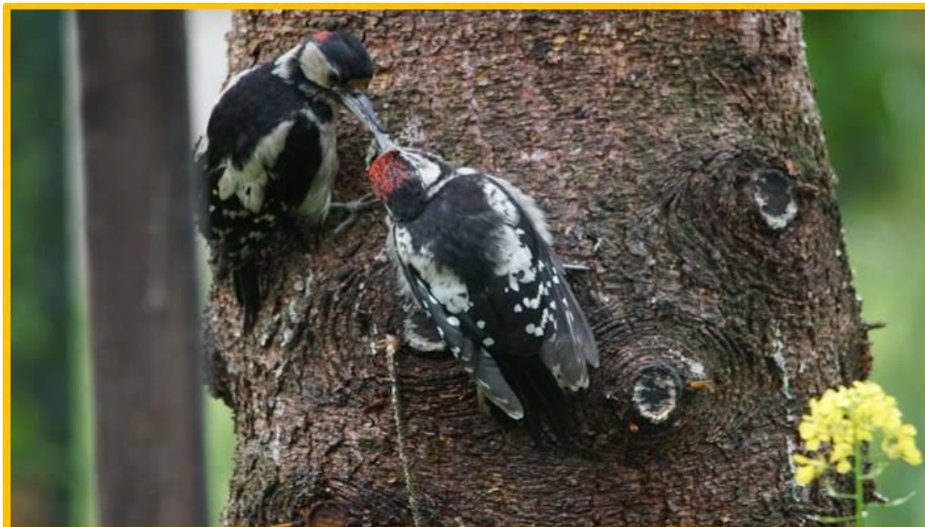
Zdjęcie 3 Dzięciół duży wiosna 2020