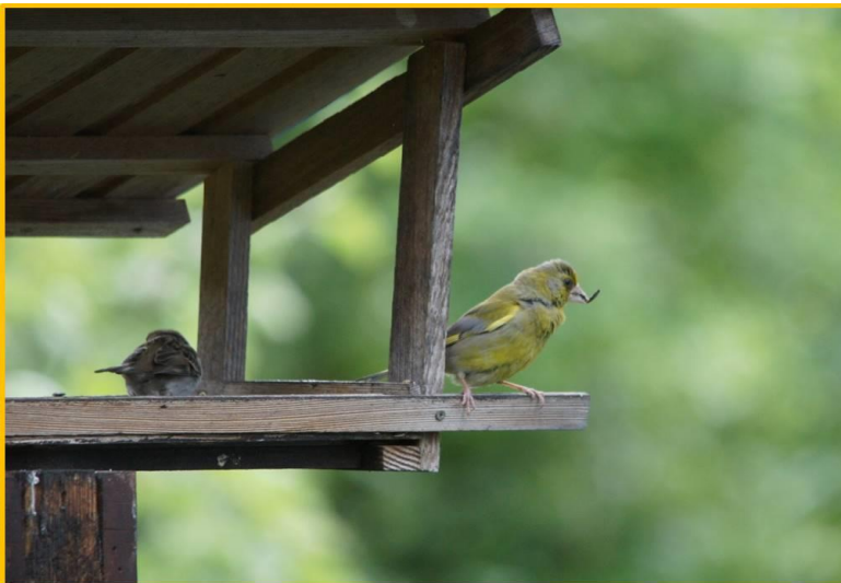
Zdjęcie 20. Dzwoniec