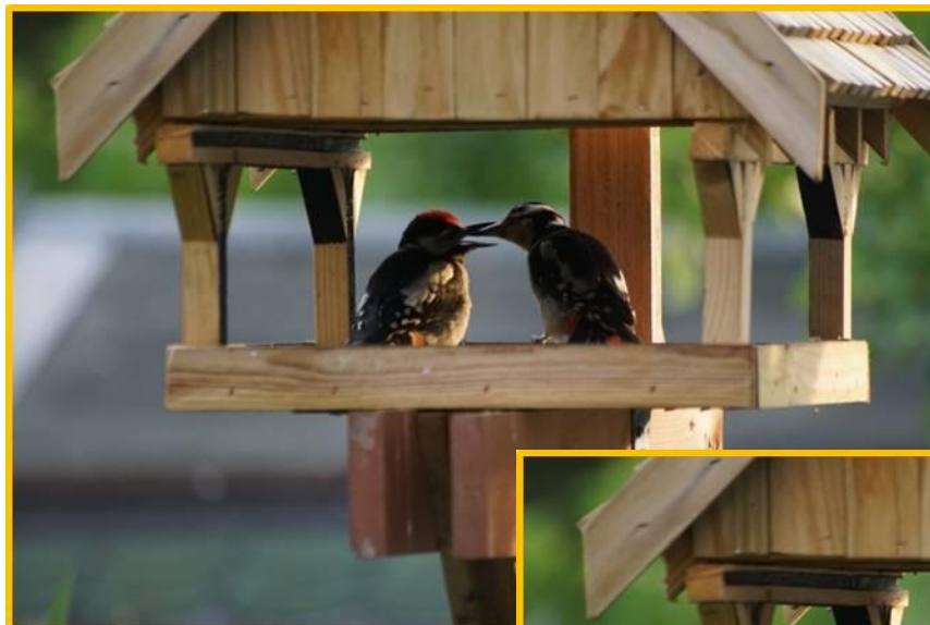
Zdjęcie 11 i 12. Dzięcioł duży. Wiosna 2023.