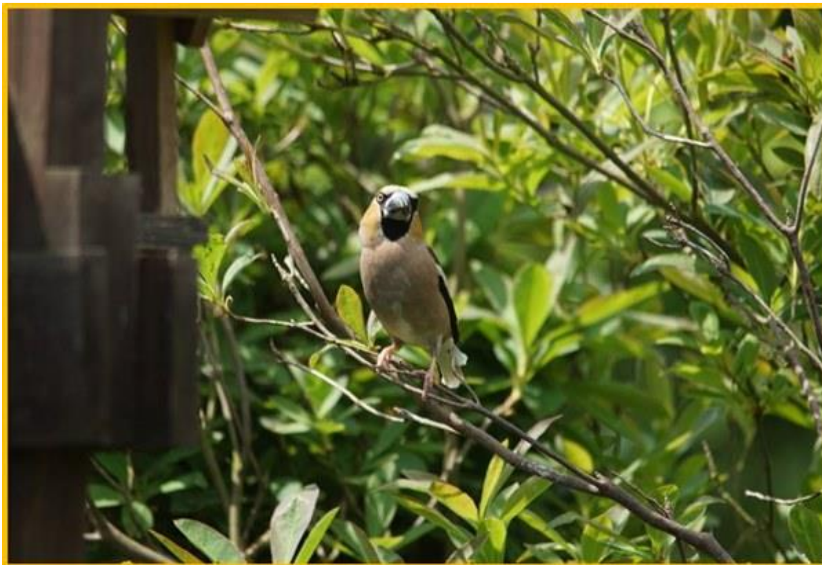
Zdjęcie 14. Grubodziób wiosna 2020

To ptak częściowo wędrowny lub osiadły w zależności od dostępności pokarmu. Na zimę wędruje w kierunku południowo-zachodnim