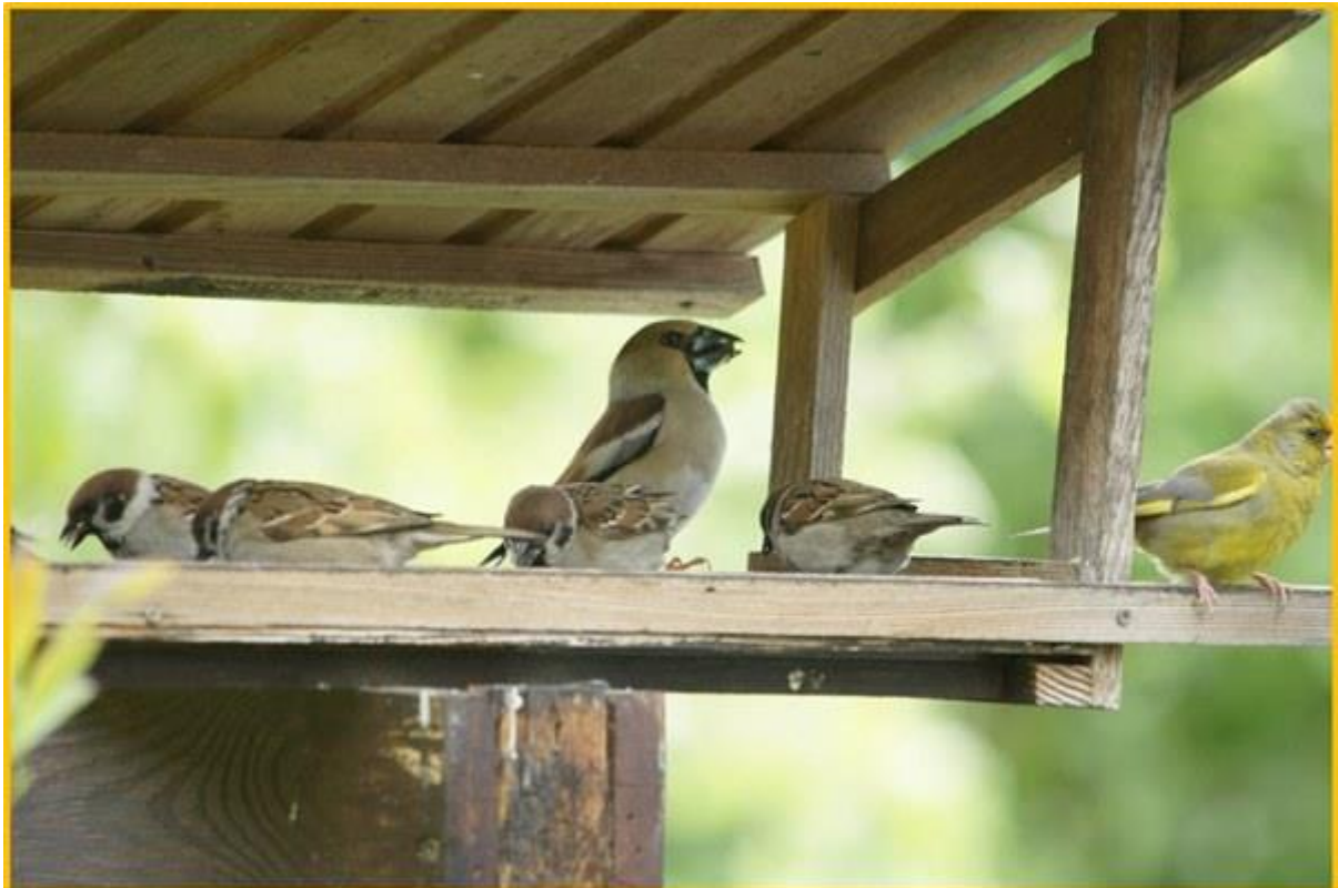
Zdjęcie 19. Grubodziób, mazaruki i dzwonec