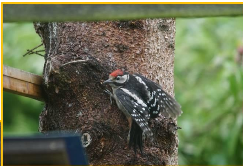
Zdjęcie 5 i 6 Dzięciot duży wiosna 2020