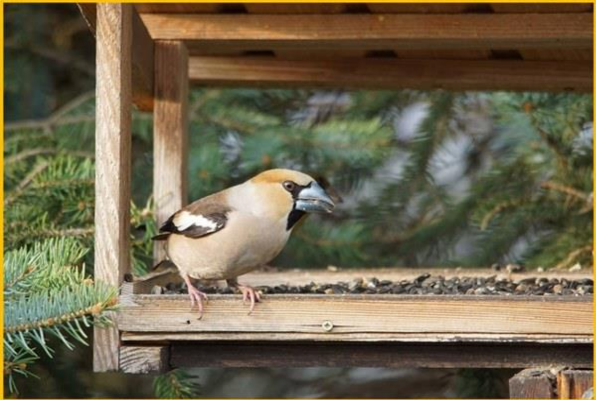
Zdjęcie 15. Grubodziób