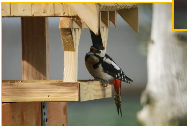
Zdjęcie 7 i 8. Dzięciot duży na nowym karmniku Wiosna 2023.