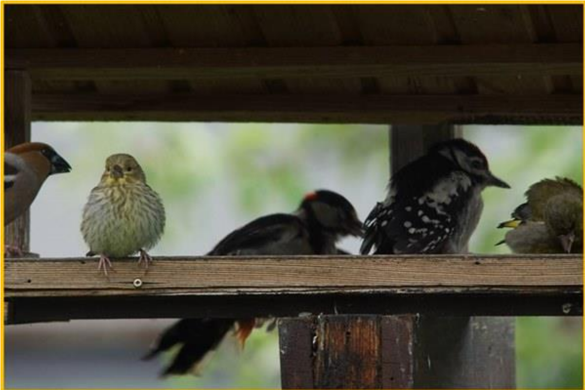
Zdjęcie 18. Grubodziób, dzwonec i dzięcioł