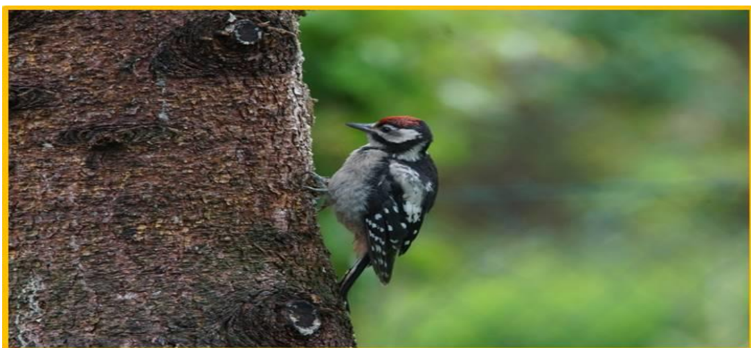
Zdjęcie 4 Dzięciół duży wiosna 2020