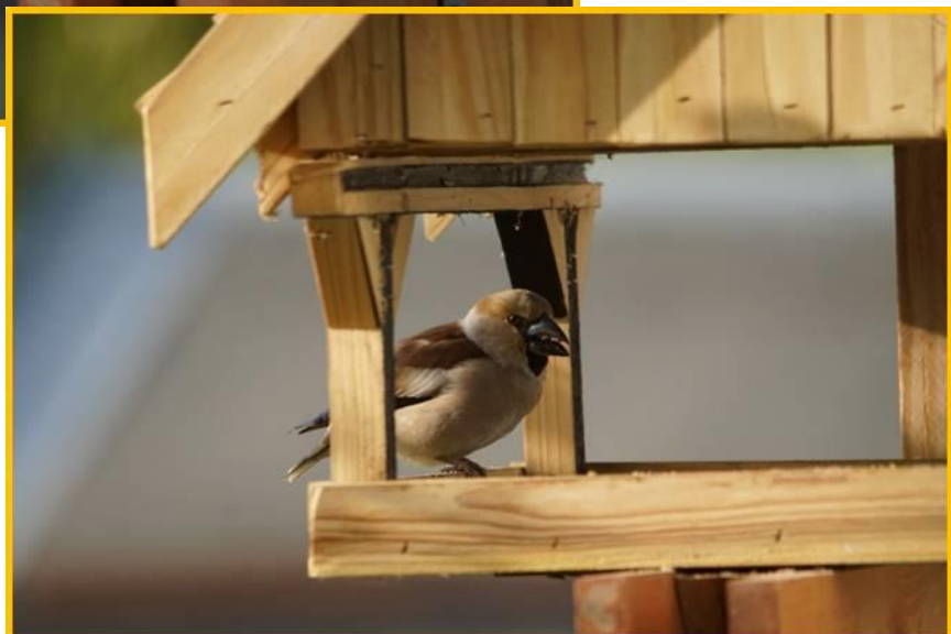
Zdjęcie 17. Grubodziób i dzwoniec