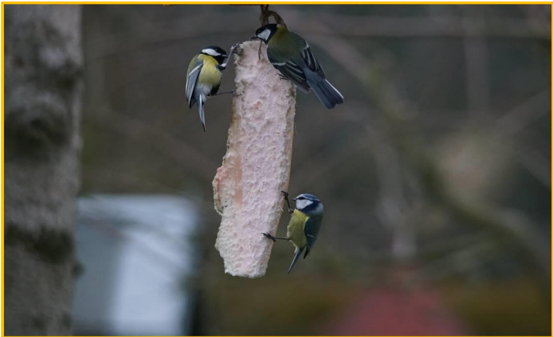
Zdjęcie 12 Bogatka i Modraszka