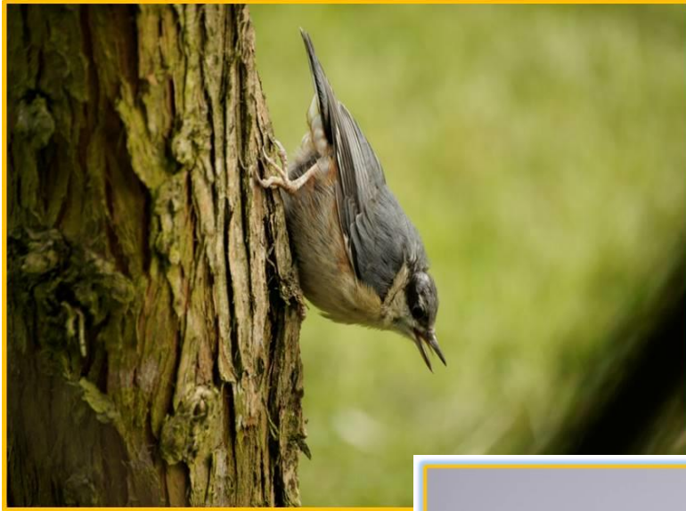
Zdjęcie 5 Kowalik

Kowalik jest ptakiem, którego można często zauważyć w ogrodzie w okresie wiosny i jesieni, gdy dostępność pożywienia jest ograniczona.