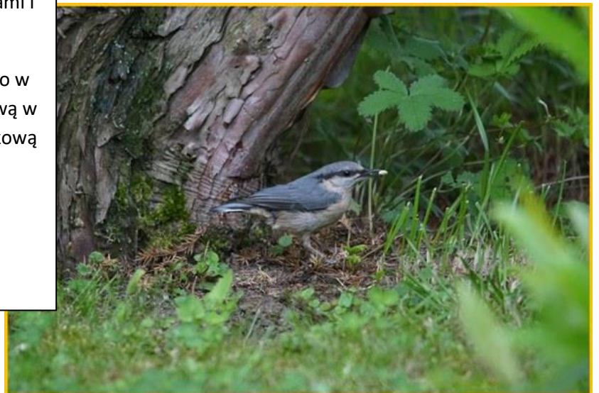
Zdjęcie 7 Kowalik