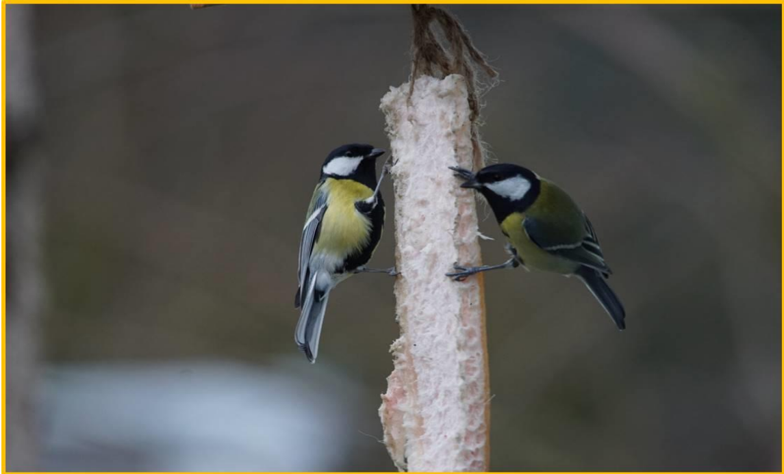
Zdjęcie 11 Bogatka grudzień 2020