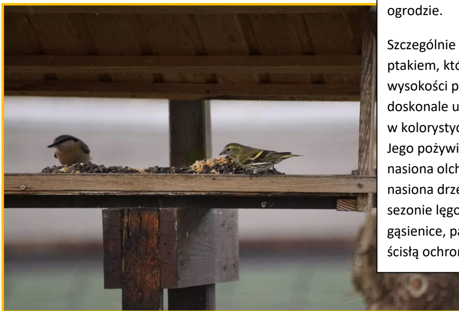
Zdjęcie 9 Czyż i Kowalik

Czyż jest ptakiem częściowo wędrownym, lub wędrownym. Na miejsce zimowania wybiera zachodnią oraz południowo-zachodnią Europę. Przeloty można zobaczyć z końcem wiosny i początkiem jesieni.