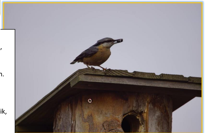
Zdjęcie 6 Kowalik

Na moim karmniku obserwuję kowalika często w okresie dokarmiania ptaków. Porusza się głową w dół. Kowalik objęty jest ścisłą ochroną gatunkową