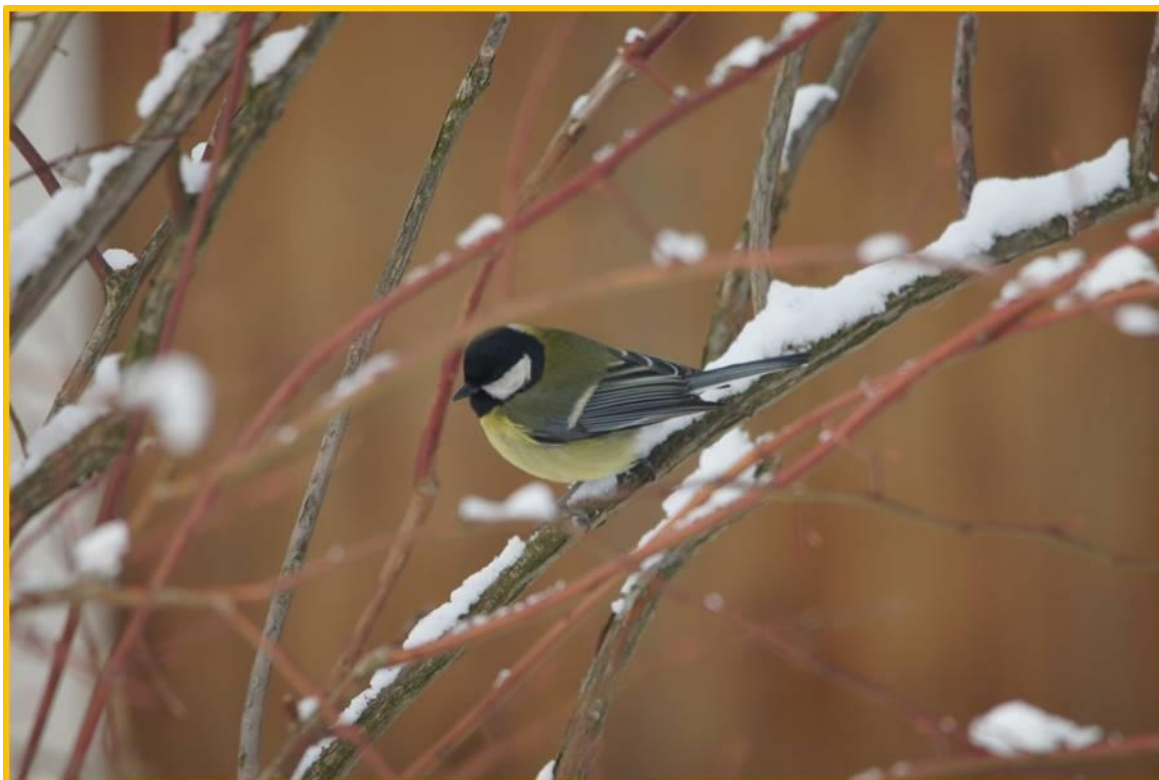
Zdjęcie 10 Bogatka

W naszym ogrodzie obserwujemy dużo sikorek.