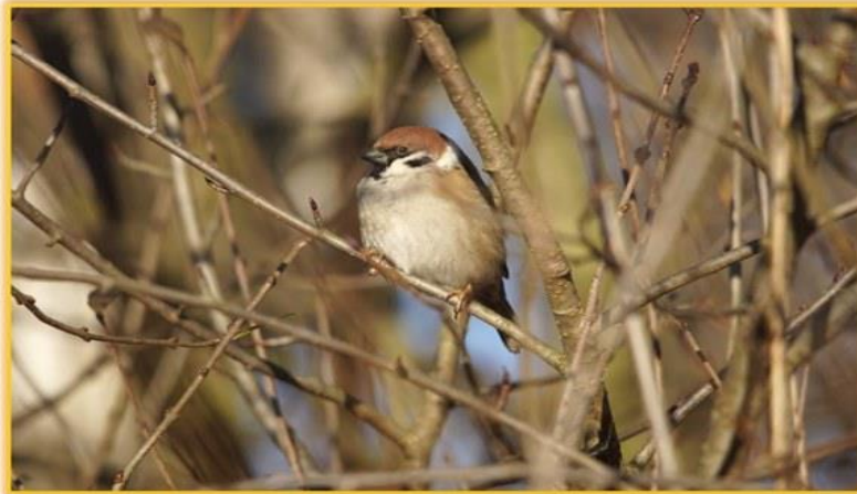
Zdjęcie 2 Mazurek