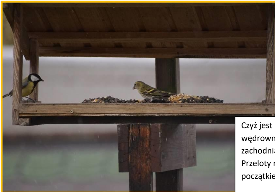
Zdjęcie 8 Czyż i Bogatka marzec 2020