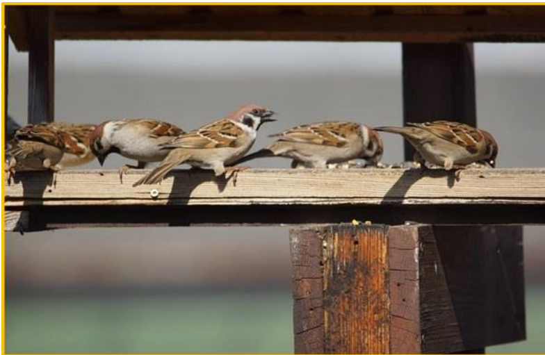
Zdjęcie 3 Mazurek marzec 2020